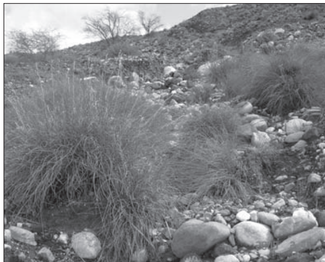
تصویر ۱- گیاه Cymbopogon olivieri

رسوبات مختلف کالرد ملائز (رسوبات رنگی) مخلوط رسوبی و آذرین و دگرگونی، واریزه‌های آهک‌های آسماری جهرم و آهک‌های آمیوسن، گروه فارس آهک و سازند میشان، کنگلومرای بختیاری، آهک همراه با