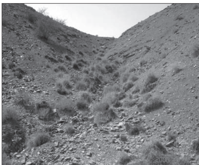
تصویر ۲- رویشگاه گونه Cymbopogon olivieri در آبراهه‌ها و دره‌های بشاگرد

رویشگاه این گونه در منطقه شیخ حضور (بستک) بسیار سنگلاخی و جهت شیب تیپ شمالی و میزان آن ۱۰ تا ۱۵ درصد می‌باشد. میزان کل پوشش گیاهی ۱۱/۳۷ درصد که از این میزان ۴/۲۷ درصد مربوط به گونه گیاهی ناگرد می‌باشد. در منطقه سرزه خارو جهت شیب منطقه شرقی - غربی و میزان شیب در این تیپ در کلاس‌های ۱۰ تا ۱۵، ۱۵ تا ۳۰ و قسمتی در کلاس ۳۰ تا ۶۰ درصد می‌باشد. میزان کل پوشش گیاهی در این تیپ ۱۵/۶۱ درصد می‌باشد که از این میزان ۹/۵۶ درصد مربوط به گونه گیاهی ناگرد می‌باشد. در منطقه بشاگرد جهت شیب منطقه عموماً شرقی - غربی است و میزان شیب در این منطقه، در کلاس‌های ۱۰ تا ۶۰ درصد می‌باشد. میزان کل پوشش گیاهی در این تیپ ۱۱/۹ درصد می‌باشد که از این میزان ۴/۷ درصد مربوط به گونه گیاهی ناگرد می‌باشد. شایان ذکر است که در قسمت‌هایی که به دلیل فرسایش زیاد و تخریب سطح رویی، مارن‌های زیرین ظاهر گردیده است این گونه دیده نمی‌شود و در