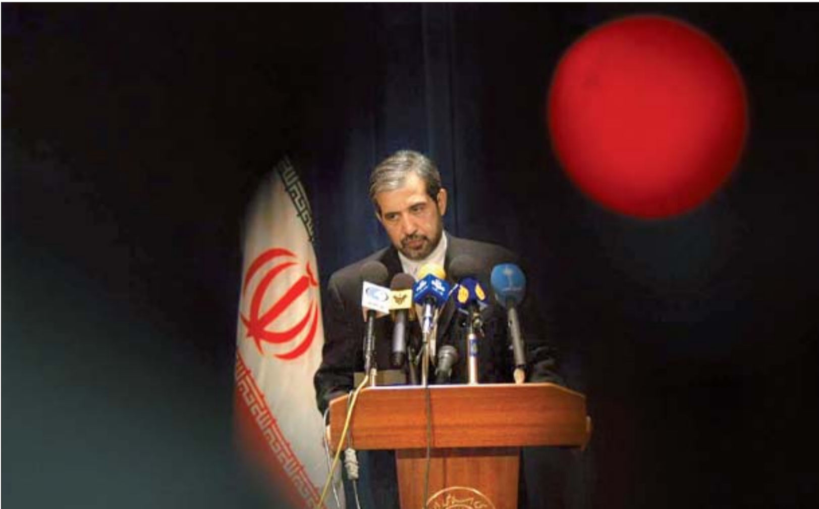
سید محمدعلی حسینی سخنگوی جدید وزارت خارجه

سید محمدعلی حسینی سخنگوی جدید وزارت خارجه شد